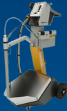
OptiFlex® Pro B Spray