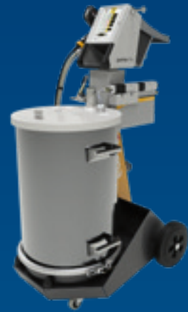
OptiFlex® Pro F Spray